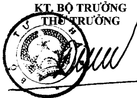
Đinh Trung Tụng