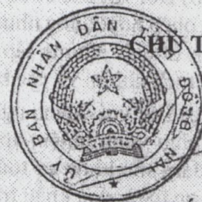
Cao Tiên Dũng