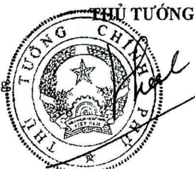
Nguyễn Xuân Phúc