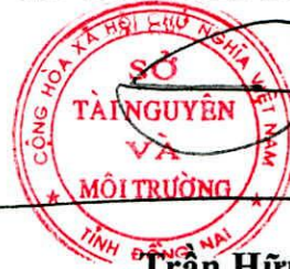
Trần Hữu Phước