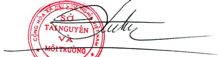
Trần Hữu Phước