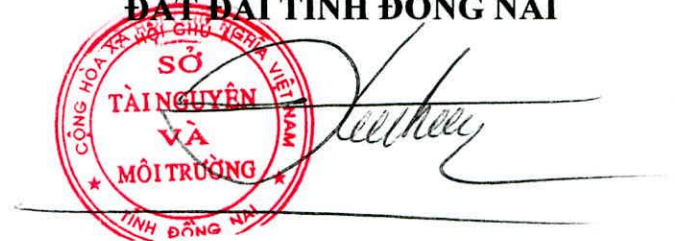
Trần Hữu Phước