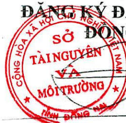
Trần Hữu Phước