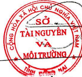
Trần Hữu Phước